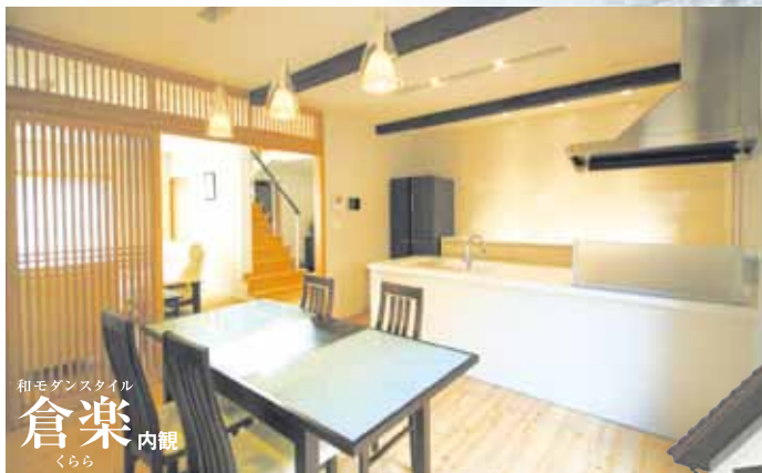
和モダンスタイル 倉楽 くらら