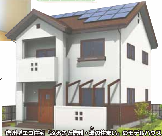
信州型エコ住宅「ふるさと信州・環の住まい」のモデルハウス

年間の冷暖房費・給湯費がまかなえる Green seed house 100%県産材仕様 グリーンシードハウス 和モダンスタイル オール電化&太陽光発電 倉楽 くらら