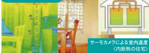
サーモカメラによる室内温度 <内断熱の住宅>

一般的な暖房システムの家では天井近くが最も温度が高く、床面と比較すると5度以上の温度差があることがわかります。足元は冷たく顔だけが熱く感じます。