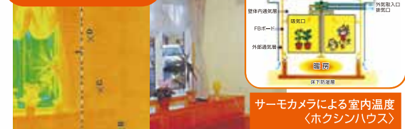
サーモカメラによる室内温度 <ホクシンハウス>

部屋中の温度が均一になっているので、足元も暖かく、快適な暖房です。また床・壁・天井から放出される輻射熱により、体の芯から暖まる快適で健康にもやさしい「本物の暖かさ」です。