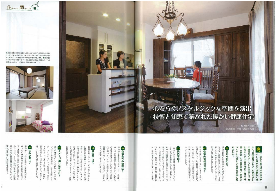
心安らくノスタルジックな空間を演出 技術と知恵で築かれた暖かい健康住宅